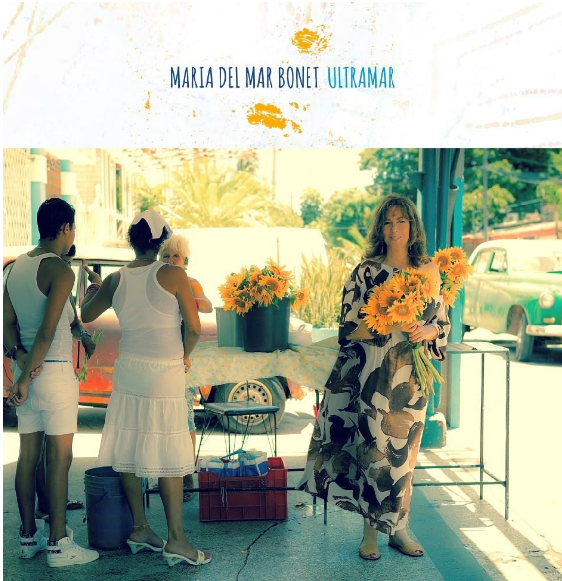
Portada del disc Ultramar, imatge de Juan Miguel Morales - l'Havana 2016