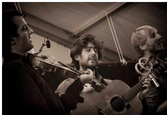
Shillelagh.