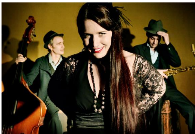
Trio Loubelya.

L'últim dia de l'Undàrius la música anirà a càrrec de Gabriel Lenoir (Flinde), Trio Loubelya (Occitània) i Al-Mayurqa (Mallorca)